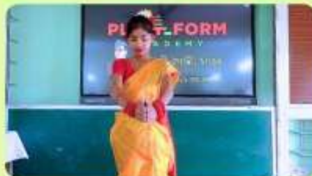
23 Jan : Dance Performance on 128th Netaji Jayanti