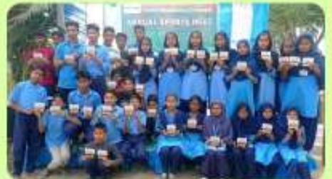
25 Feb : 'Frame of Winners' of Annual Sports of Senior School