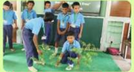
5 Jun : Drama Played by Juniors on Int. Environment Day