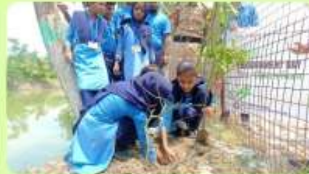
5 Jun : 'Tree Plantation' on International Environment Day