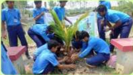
5 Jun : 'Tree Plantation' on International Environment Day