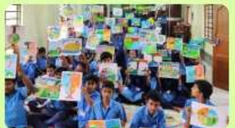
3 Jun : 'Arts & Artists' - Annual Drawing Competition (Senior)