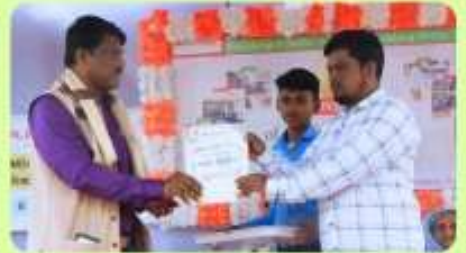
8 Jan : Release of Annual Magazine 'Shobdo Michhil'