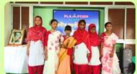
7 May : Chorus on Rabindra Sangeet on his birth anniversary