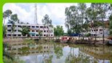
POND & CAMPUS