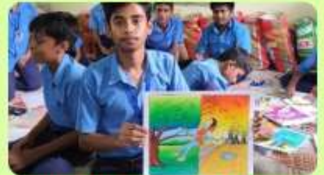
3 Jun : Artist & his Art - Annual Drawing Competition (Senior)