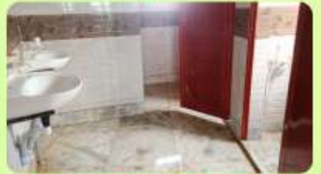
Renovated Modern Washroom for Hostel Students