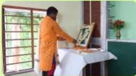
7 May : 'Kabi Pranam' - 164th Rabindra Jayanti