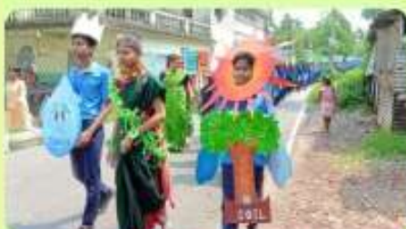
5 Jun : International Environment Day