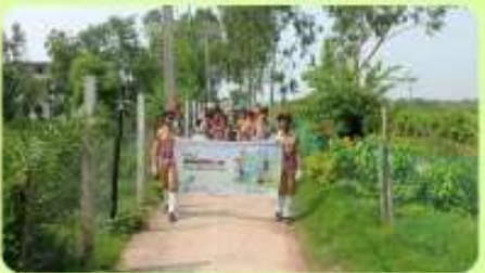
5 Jun : 'Provat Feri' on International Environment Day