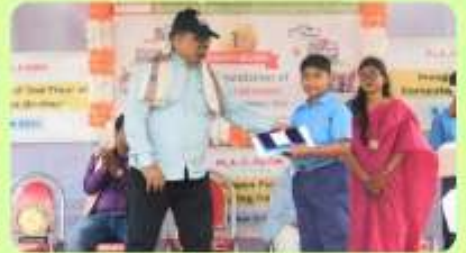
8 Jan : Academic Topper of 2023 of Senior School