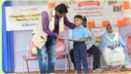
8 Jan : An Academic Topper of 2023 of Junior School