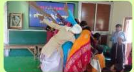
7 May : 'Ekannobarti' Drama Played on Rabindra Jayanti