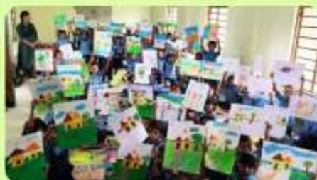
5 Jun : Junior Artists - Annual Drawing Competition (Junior)