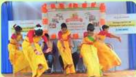
8 Jan : 1st Anniversary of the Foundation, Celebration