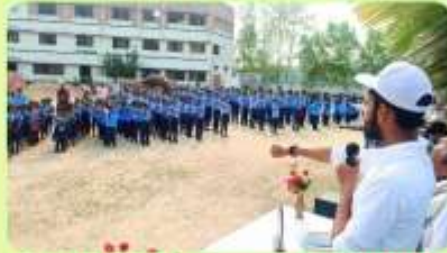
24 Feb : Oath Ceremony before Annual Sports Meet 2024