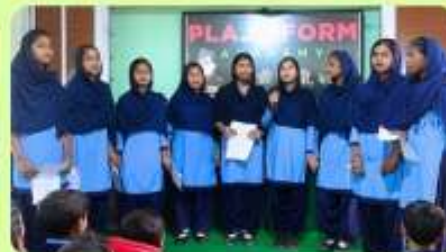
23 Jan : Patriotic Song sang by Class VIII & IX Girls