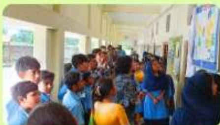
7 May : Teachers & Students Gathered at 'Ichchhe Dana'