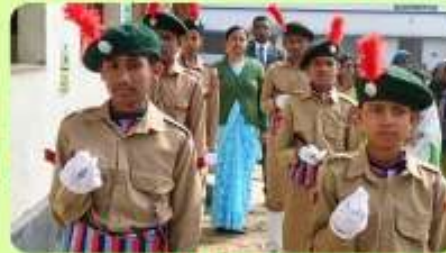
26 Jan : Chief Guest receives Guard of Honour