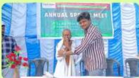
24 Feb : Felicitation to Ex-Head Master, Nilambarpur High School