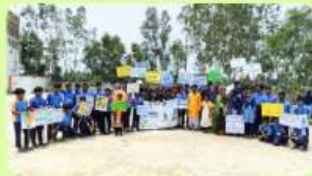
5 Jun : All Models and Drama Performers in a Single Frame