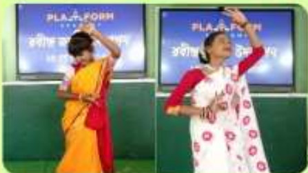
7 May : Dance Performances on 'Rabindra Sangeet'