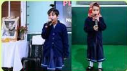
12 Jan : Performing Future Youths on National Youth Day