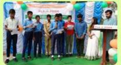
26 Jan : Students with their teachers Singing Patriotic Song