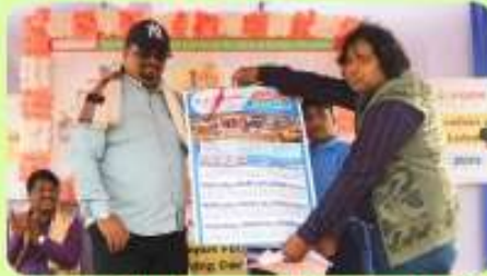
8 Jan : Disclosure of Calender of the year 2024