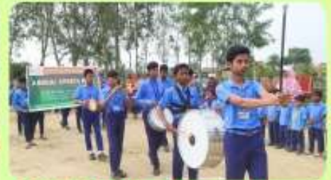
24 Feb : Band on Inauguration of Annual Sports Meet 2024