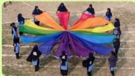
24 Feb : 'Sharee Drill' - Inauguration of Annual Sports