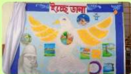
3 Jun : Publish of Annual Wall Magazine 'Ichche Dana'