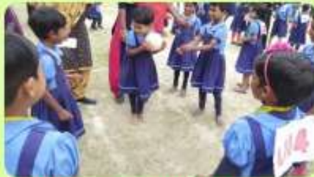
25 Feb : 'Musical Ball' of Juniors on Annual Sports Meet 2024