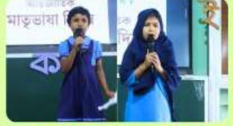
21 Feb : International Mother Language Day